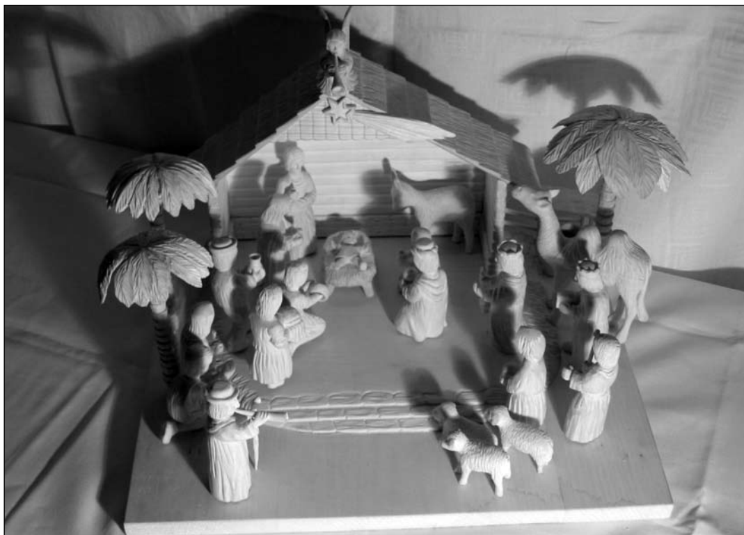
BETLEHEM NA OBRÁZKU zhotovil z lipového dreva pán Jozef Ľapák z domu č. 107. Teraz vyrezáva Pána Ježiša, ktorého chystá ako darček, a pokračuje v práci na štvormetrovej reťazi vyhotovenej z jedného kusa.

(Dokončenie na 2. strane) (Pokračovanie z 1. strany)